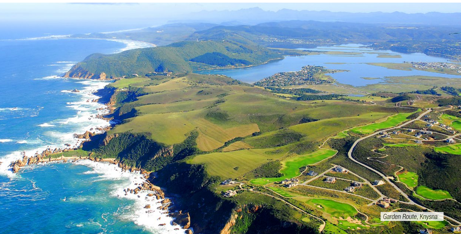
Garden Route, Knysna

ze paesaggistiche spettacolari. God's Window : un ottimo luogo dal quale poter ammirare il suggestivo paesaggio del Lowveld Bourke's Luck Potholes, uno straordinario esempio di erosione del fiume. Le profonde cavità cilindriche sono state scavate nel corso dei tempi dalla forza dell'acqua alluvionale. Three Rondavels , parte del Blyde River Canyon. Pranzo lungo il percorso. Proseguimento quindi per la riserva privata di Makalali. La riserva privata di Makalali è situata vicino alle montagne Drakensberg a ovest del Parco Kruger. Si estende su 26.000 ettari nel nord-est di Lowveld, in Sudafrica. La riserva naturale vanta i "Big Five" - leone, leopardo, elefante, rinoceronte e bufalo. Altre specie caratteristiche sono il ghepardo, il licaone, la giraffa, la zebra e il kudu (antilope). Nel pomeriggio, primo safari fotografico all'interno della riserva privata. Cena e pernottamento al lodge.