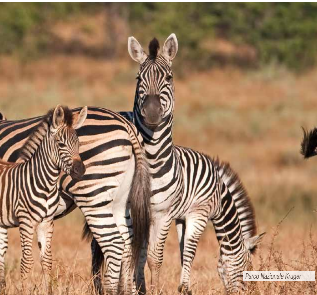
Parco Nazionale Kruger

Diritti apertura pratica € 80 p.p. che includono assicurazione medico-bagaglio • Volo aereo intercontinentale Italia/ Sudafrica/ Italia • Tasse aeroportuali • Tasse locali • Pasti non espressamente indicati • Trasferimenti non espressamente indicati • Bevande ai pasti • Mance ed ingressi • Facchinaggio • Tutto quanto non espressamente indicato ne "Le quote comprendono".