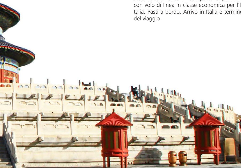
Pechino: Tempio del Cielo

Diritti apertura pratica • Pasti non espressamente indicati e bevande • Tasse aeroportuali • Visto d'ingresso in Cina (130 € p.p. + spese) • Mance (obbligatorie) • Facchinaggio • Tutto quanto non espressamente indicato ne "Le quote comprendono".