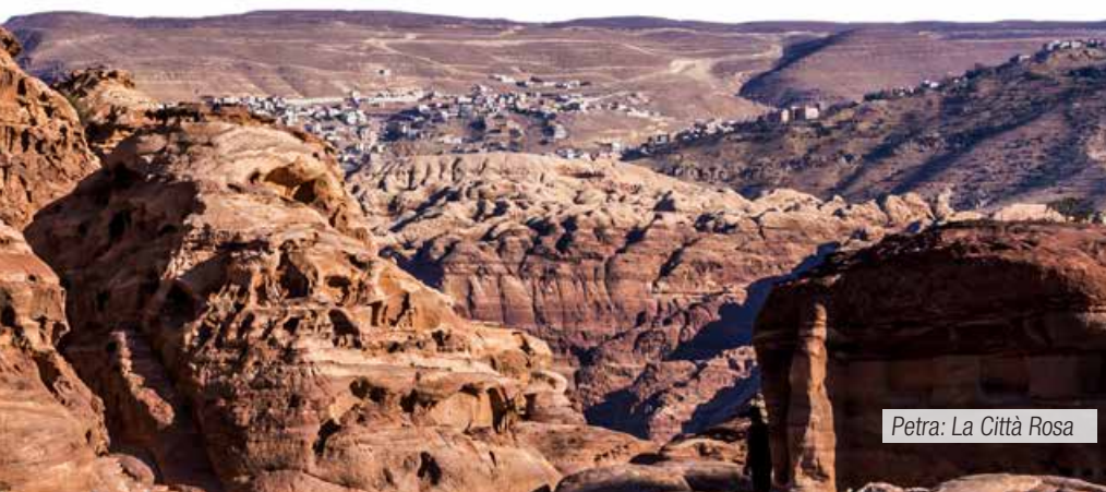
Petra: La Città Rosa

Escursione in jeep 4x4 nel deserto di Wadi Rum.