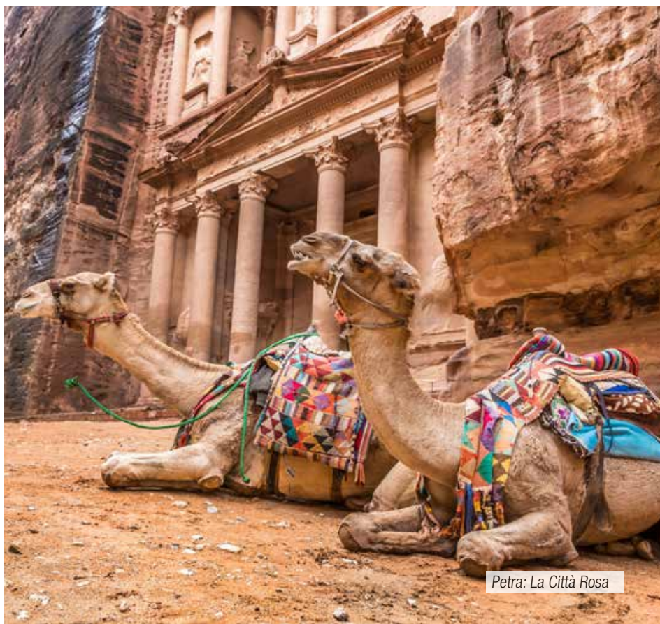
Petra: La Città Rosa