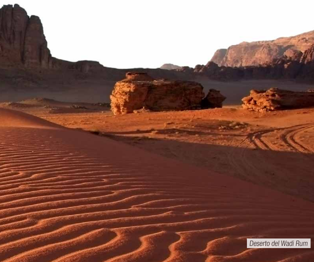
Deserto del Wadi Rum