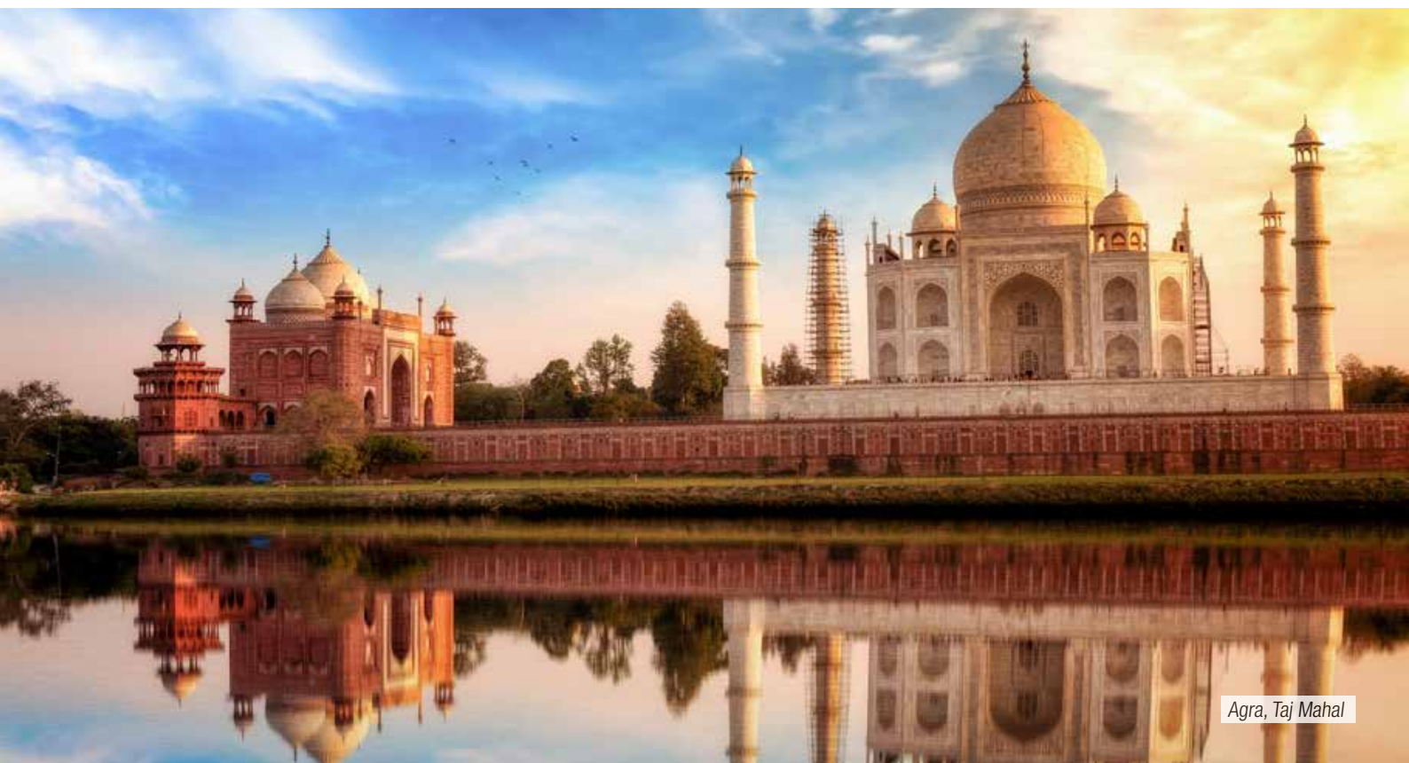
Agra, Taj Mahal

Prima colazione in hotel. Al mattino proseguimento della visita guidata di Delhi partendo dalla Jama Jama Masjid , la più grande moschea dell'Asia, edificata nel 1650. A seguire,