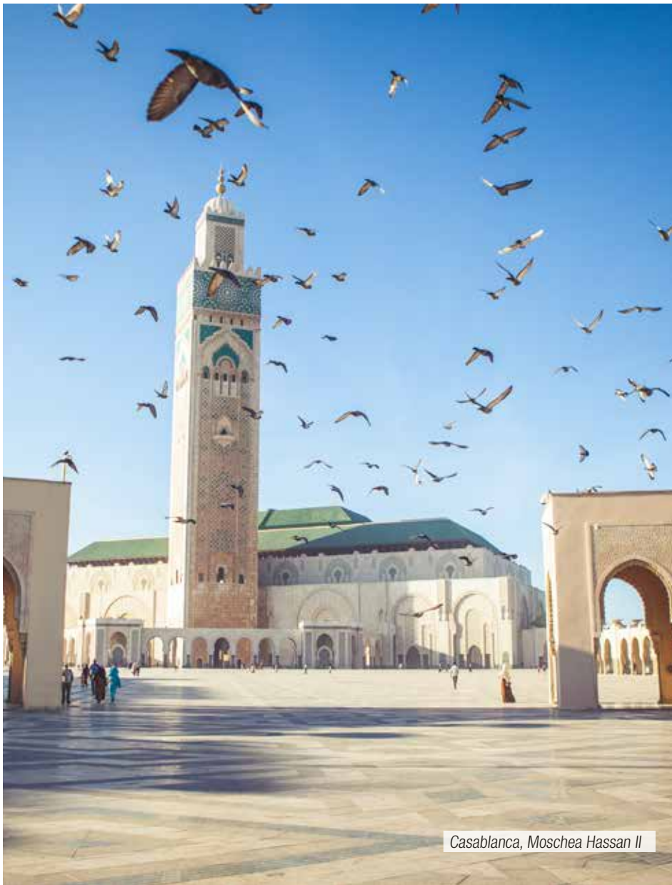
Casablanca, Moschea Hassan II

Prima colazione in hotel. Trasferimento in aeroporto e termine dei servizi.