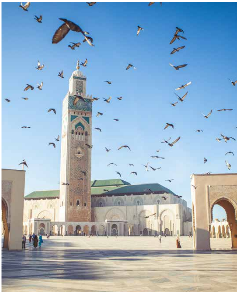
Casablanca, Moschea Hassan II

Prima colazione in hotel. Trasferimento in aeroporto e termine dei servizi.