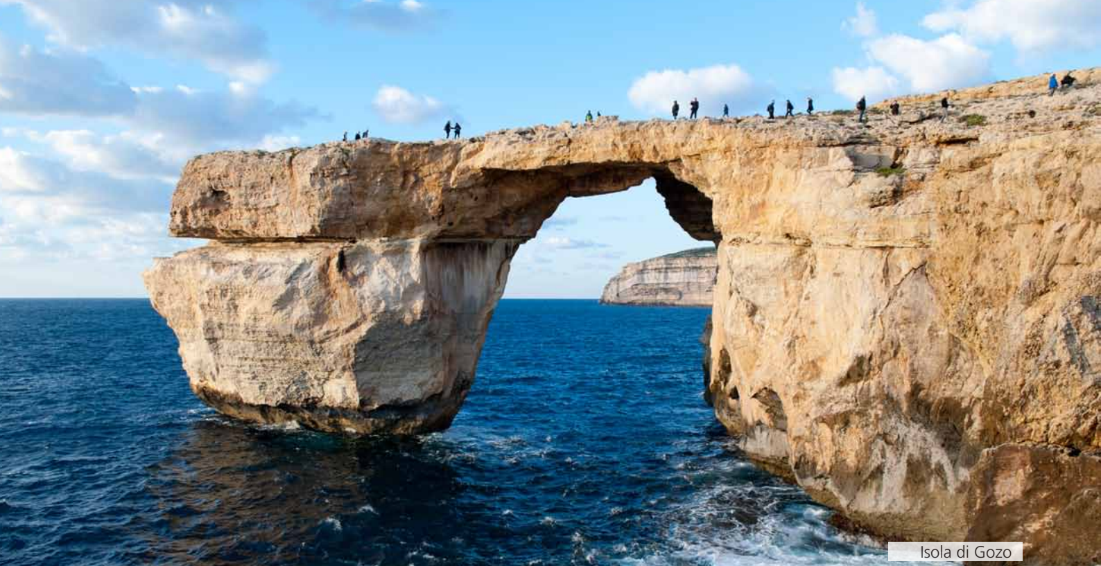
Isola di Gozo