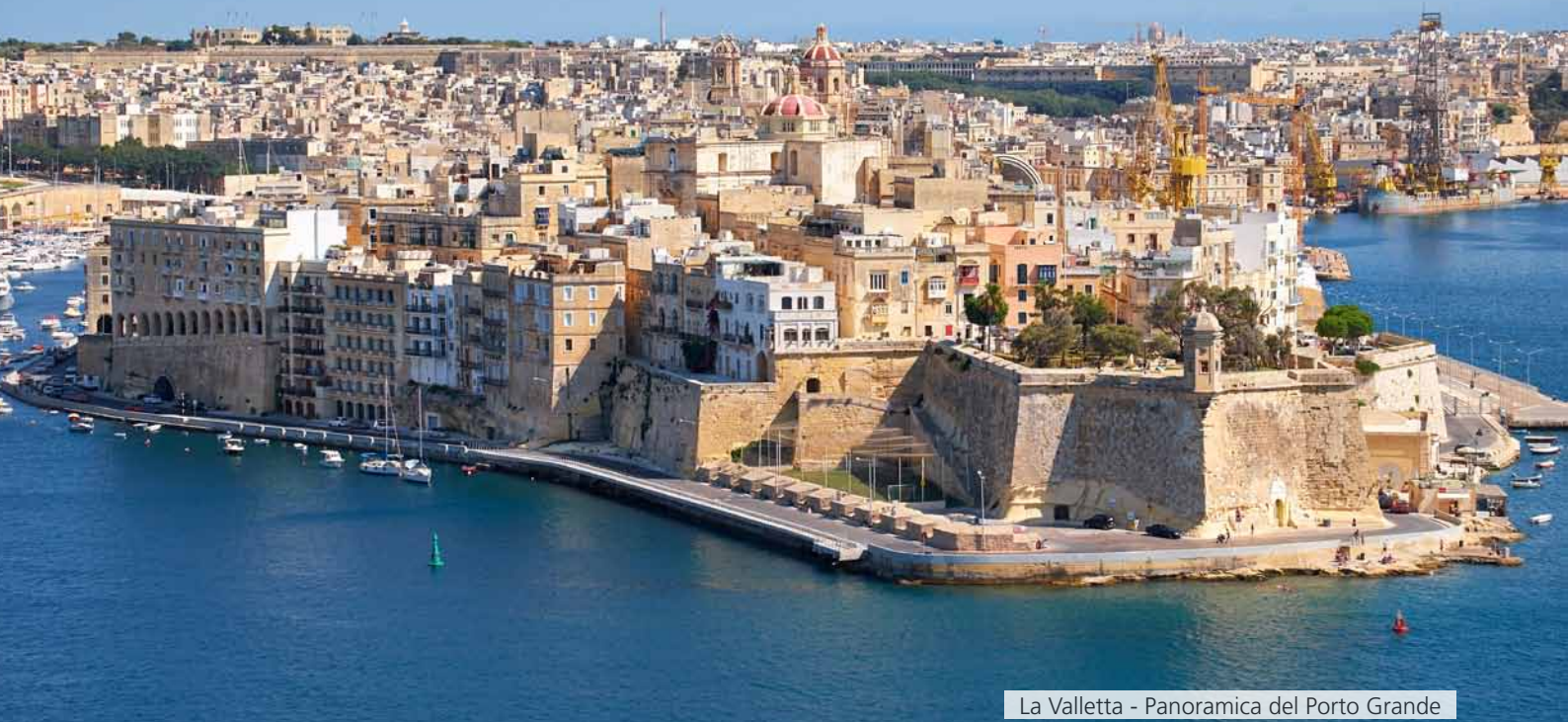
La Valletta - Panoramica del Porto Grande