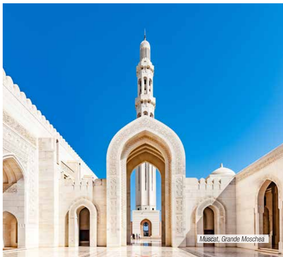
Muscat, Grande Moschea

In base agli operativi volo utilizzati potrebbe essere richiesto un supplemento per i trasferimenti da/per l'aeroporto.