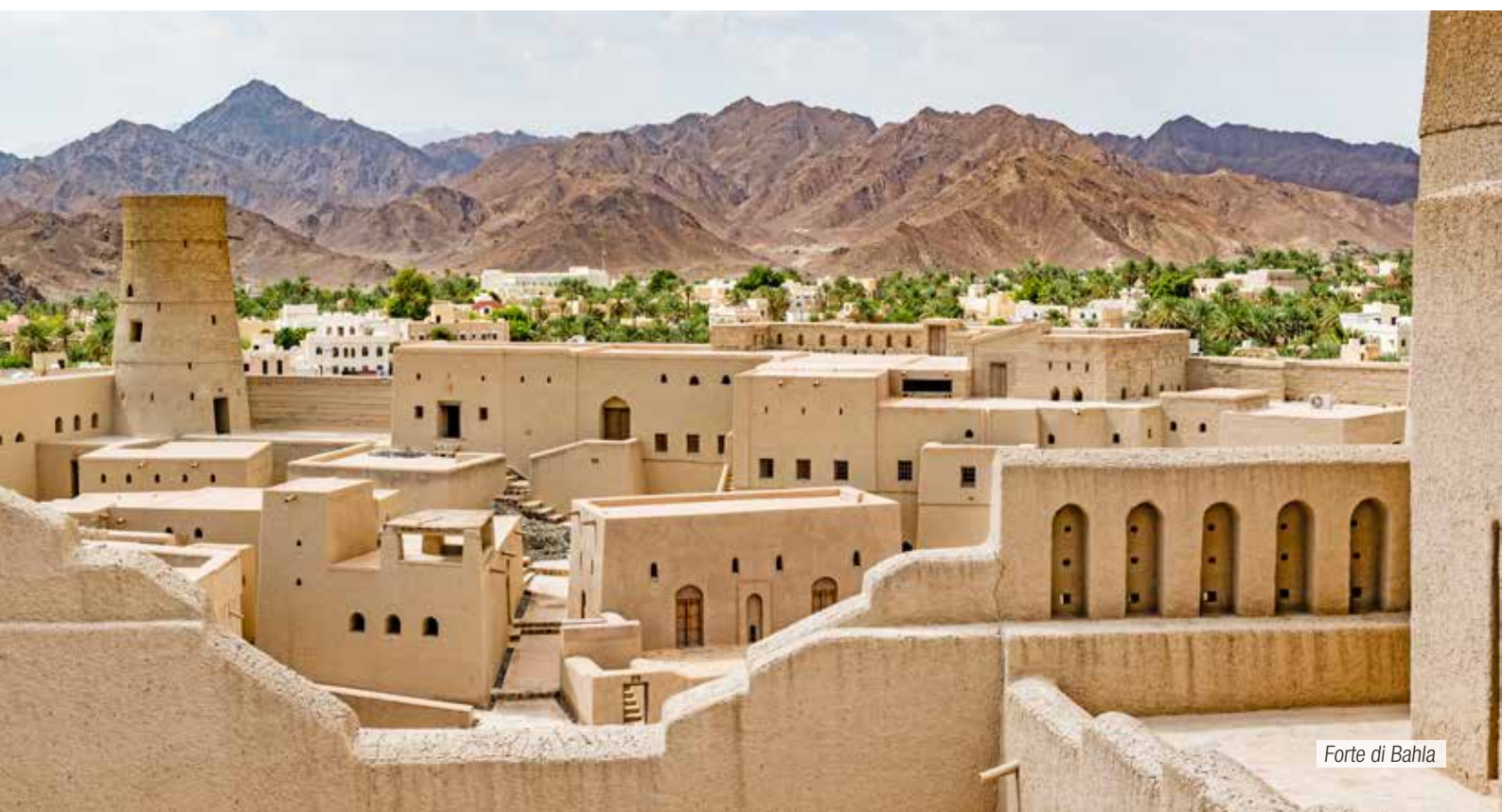
Forte di Bahla