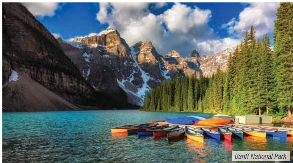
Banff National Park

Prima colazione in hotel. Partenza per Tadoussac e imbarco in mattinata per la crociera in battello per l'osservazione delle balene, un'esperienza unica e indimenticabile. Pranzo presso lo storico hotel Tadoussac. Proseguimento verso la regione del Charlevoix, nominata dall'Unesco Riserva Mondiale della Biosfera. Breve tragitto in traghetto e arrivo in un tipico hotel canadese del XVIII secolo. Cena e pernottamento.