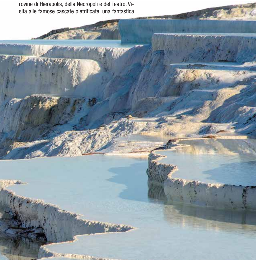
Pamukkale - Piscine calcaree naturali

Prima colazione in hotel. Tempo a disposizione e, all'ora preventivamente convenuta, trasferimento all'aeroporto e termine dei servizi.