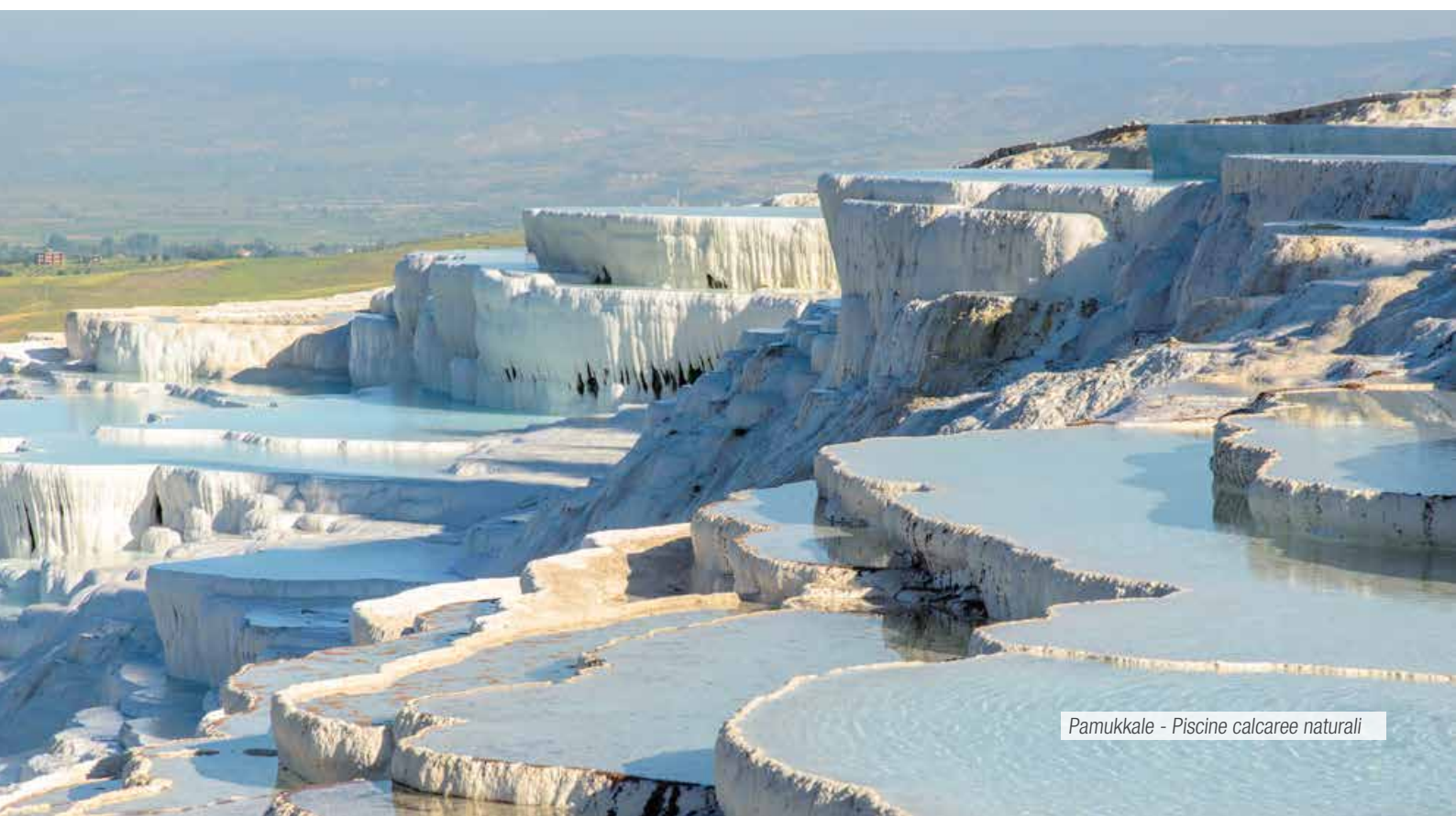
Pamukkale - Piscine calcaree naturali

Prima colazione in hotel. Intera giornata dedicata alla visita della Cappadocia: la Valle Pietrificata di Goreme, detta anche "la Valle dei Camini delle Fate", interamente cosparsa da alte colonne di tufo che conferiscono alla valle un aspetto fiabesco, con le sue Chiese rupestri decorate con affreschi;