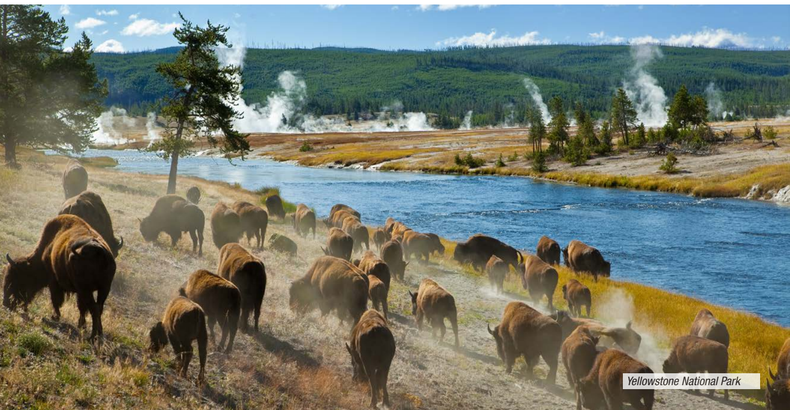
Yellowstone National Park

Prima colazione in hotel. Partenza a bordo di un piccolo treno che, attraversando le Black Hills, condurrà fino a Mount Rushmore, complesso scultoreo che si trova sul massiccio montuoso delle Black Hills, formato da enormi blocchi granitici. Su una grande parete di roccia, lo scultore Gutzon Borglum, coadiuvato dal mastro carpentiere italiano Luigi del Bianco, scolpì i volti di quattro famosi presidenti americani: George Washington, Thomas Jefferson, Theodore Roosevelt e Abraham Lincoln, scelti rispettivamente come simboli della nascita, della crescita, della conservazione e dello sviluppo degli Stati Uniti. La scultura fu iniziata